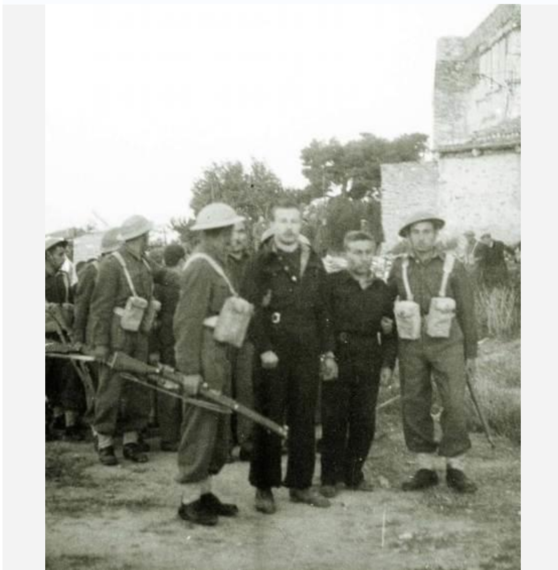
Προετοιμασία – Οι καταδικασθέντες μελλοθάνατοι – Το εκτελεστικό απόσπασμα από κληρωτούς φαντάρους

Χωρίς πολλά λόγια (δεν χρειάζονται), παρουσιάζουμε δύο φωτογραφίες τραβηγμένες ένα πρωινό του 1947 στη Θεσσαλονίκη, στο Γεντί-Κουλέ, πίσω από τις Φυλακές Επταπυργίου, στον "συνήθη τόπο εκτελέσεων", στα πλαίσια της εφαρμογής του Γ' Ψηφίσματος, προφανώς.