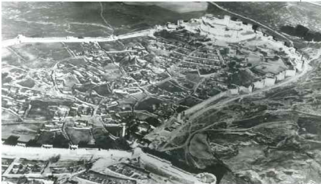
Η περιοχή της Ακρόπολης με το Επταπύργιο, σε αεροφωτογραφία της περιόδου του Α΄ Παγκοσμίου Πολέμου.